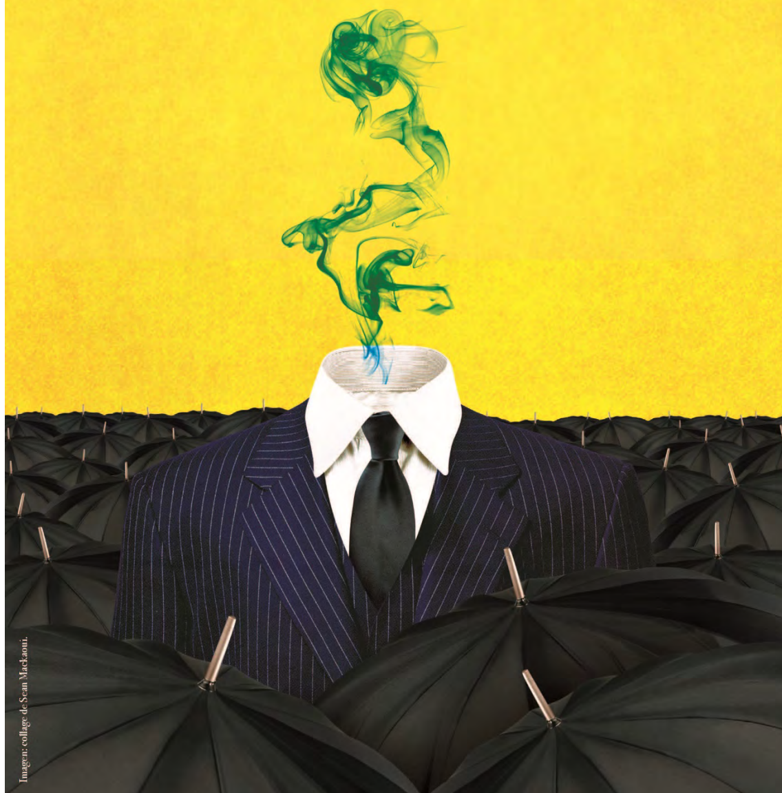
Imagen collage de Sean MacLanani.

Acoso, difamación y censura en las redes sociales