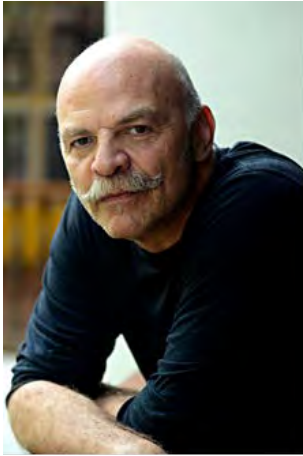
Martín Caparrós, periodista y escritor

(Buenos Aires, 1957) se licenció en historia en París, vivió en Madrid, Nueva York y Barcelona, hizo periodismo en gráfica, radio y televisión, dirigió revistas de libros y revistas de cocina, tradujo a Voltaire, a Shakespeare y a Quevedo, recibió la beca Guggenheim, los premios Planeta y Herralde de novela, los premios Tiziano Terzani y Miguel Delibes de ensayo, los premios Rey de España y Moors Cabot de periodismo, plantó un limonero, tiene un hijo y ha publicado unos treinta libros –en unos treinta países. Los últimos son la novela La Historia , el ensayo El Hambre , las crónicas de Lacrónica , las fotos de Postales .