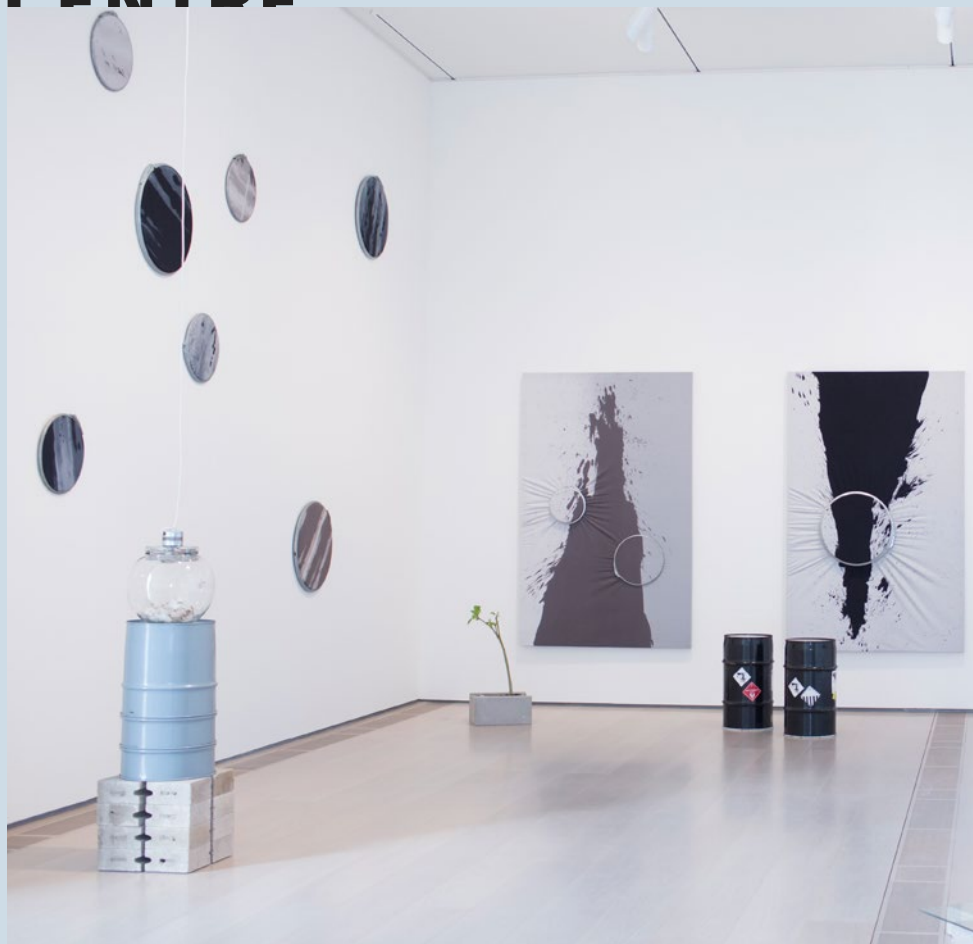
ELENA BAJO | The Owl of Minerva only Flies at Dusk (Urania's Mirror)