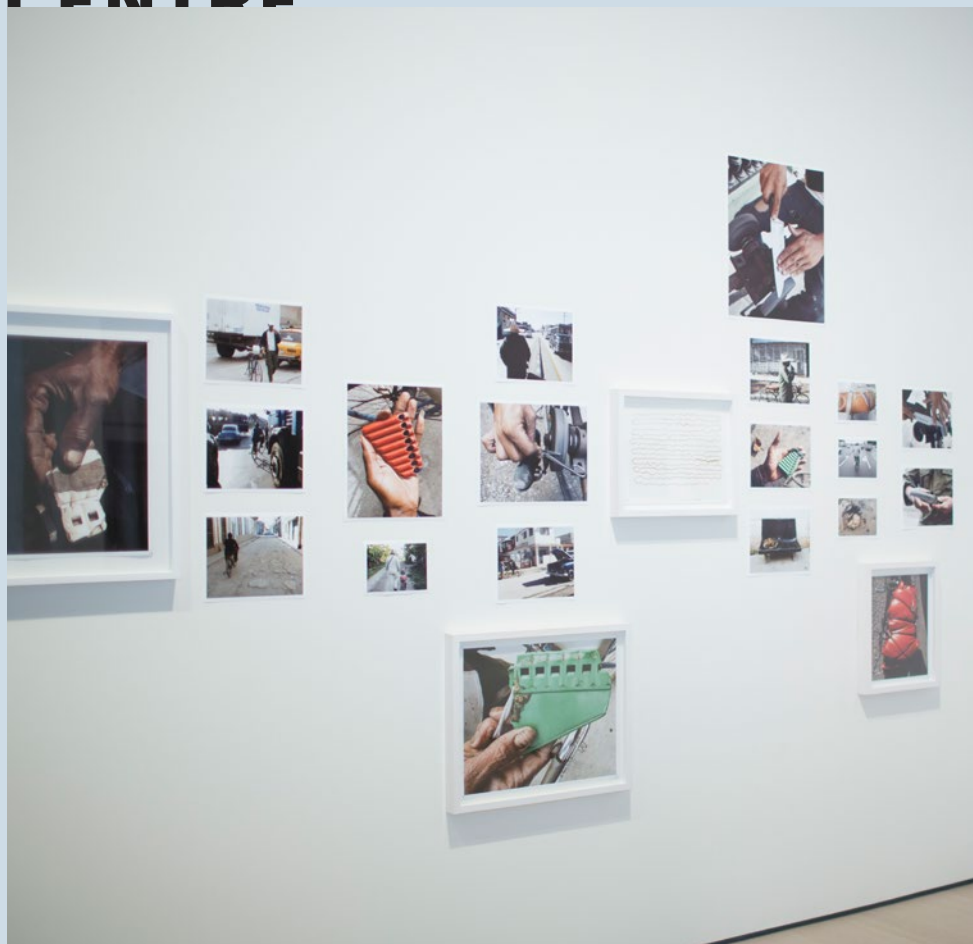
FELIPE DULZAIDES | Deja tu tono después del mensaje