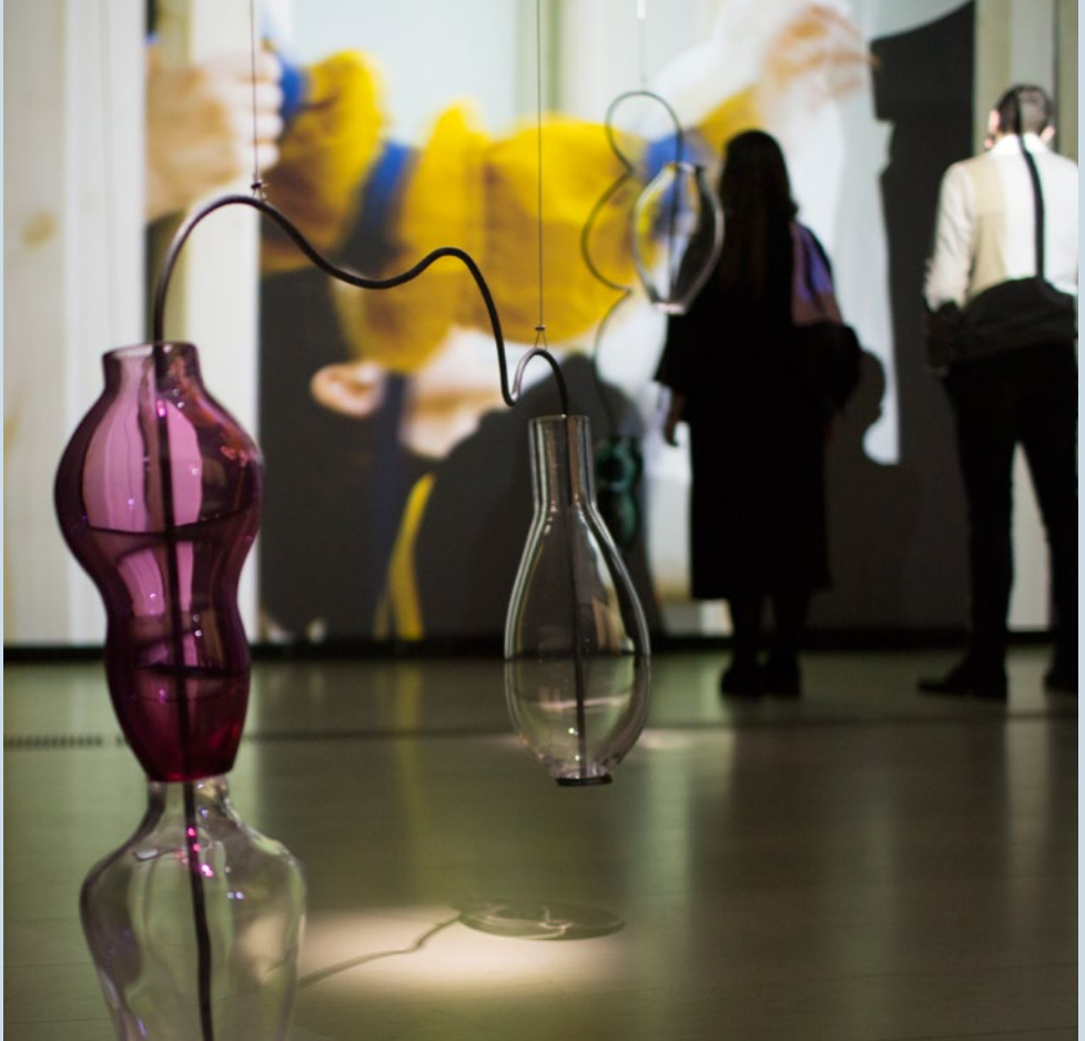
LEONOR SERRANO RIVAS | The Dream Follows the Mouth (of the one who interprets it)