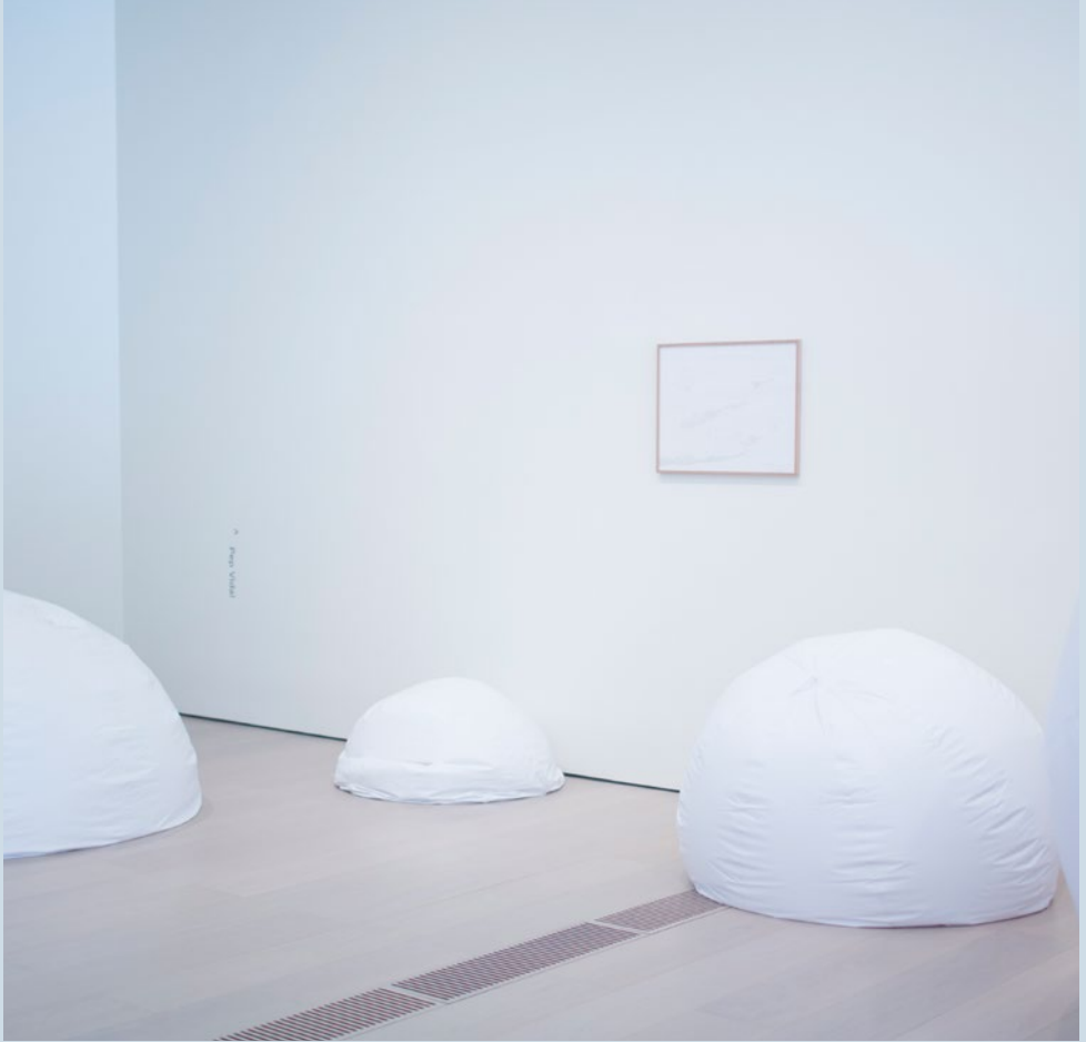
PEP VIDAL | Domingo en el parque a las 10h10