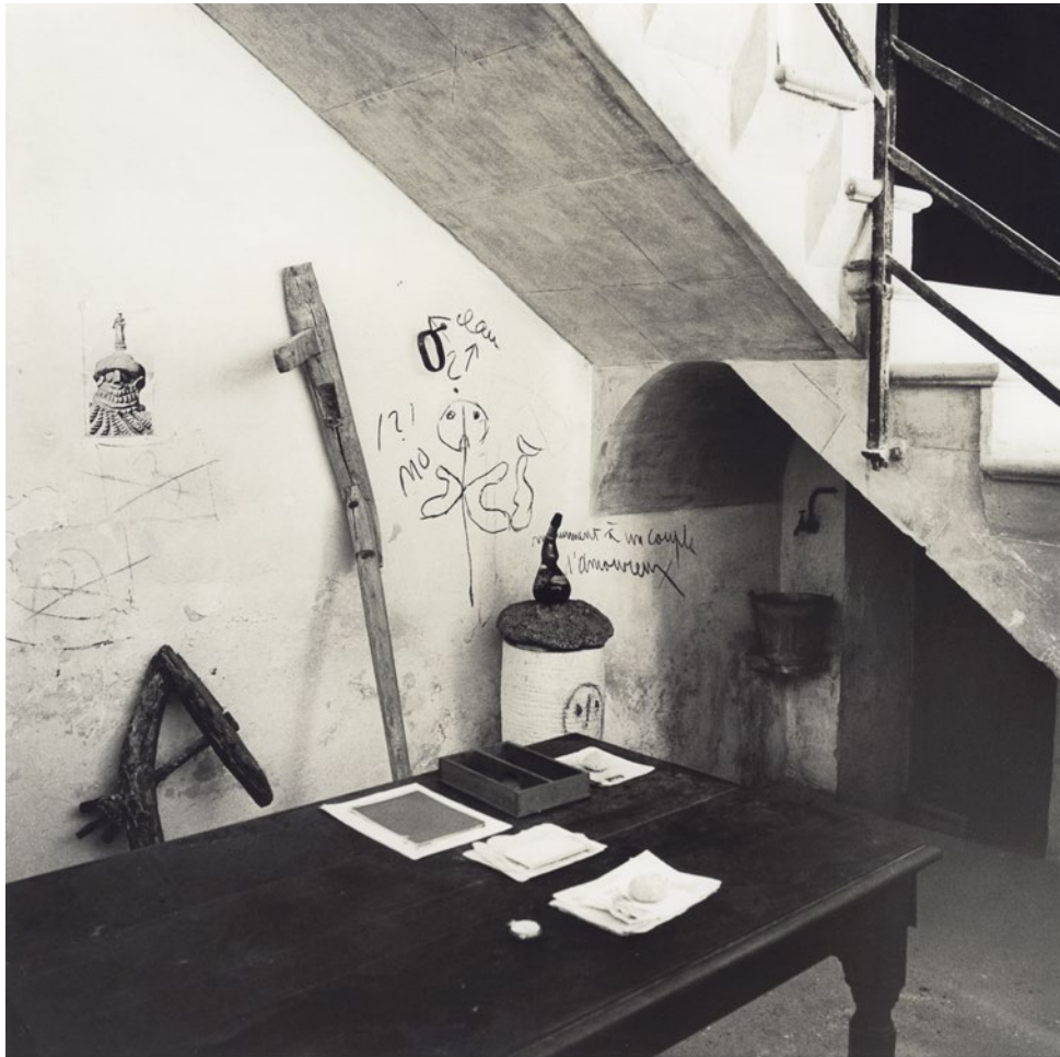
Vista de Son Boter con los objetos para Homme et femme . Palma de Mallorca, c. 1968 Josep Planas Montanyà. Colección particular