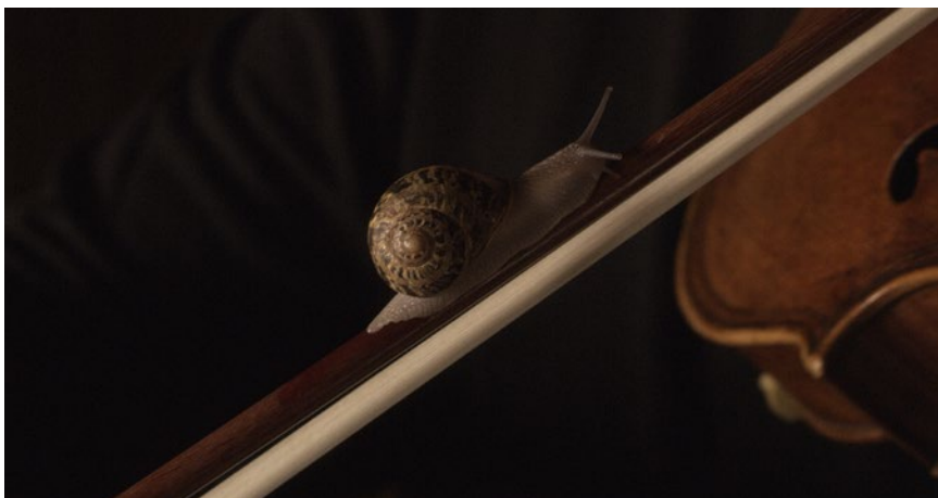
Anri Sala. If and Only If , 2018. Single-channel HD color video and discrete 4.0 surround sound installation. 9min 47s. Edition 4/6 + 3 AP ©Anri Sala

El Centro Botín acoge la exposición AS YOU GO (Châteaux en Espagne) de Anri Sala (Tirana - Albania, 1974), uno de los artistas más influyentes de la cultura contemporánea, cuyo trabajo indaga en los modos no verbales de comunicación por medio de novedosas técnicas narrativas que introduce por medio de la imagen en movimiento, la música, el sonido y la propia arquitectura del lugar en el que expone, generando una experiencia inmersiva en el espectador de alto impacto sensorial.