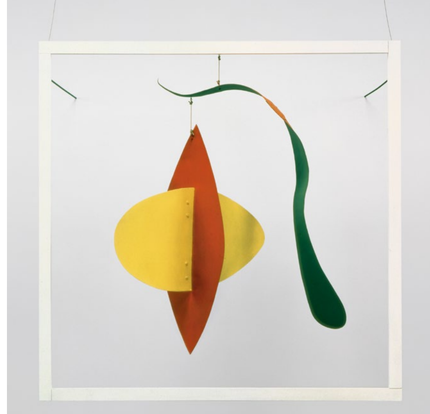
Alexander Calder. Snake and the Cross , 1936. Plancha metálica, madera, varilla, alambre, hilo y pintura. 205,74 x 129,54 x 111,76 cm. Calder Foundation, New York.

pos de trabajos realizados en todo tipo de soportes, cada uno vinculado a proyectos concretos y, en muchos casos, por encargo de algunos de los arquitectos más notables del siglo veinte como Wallace K. Harrison, Percival Goodman u Oscar Nitzschke, así como visionarios como el marchante de arte francés convertido en piloto de carreras Hervé Poulain, que pidió a Calder que pintara un BMW 3.0 CSL con el que compitió en la carrera de resistencia de las 24 Horas de Le Mans. Con su conversión de un automóvil en un cuadro en movimiento Calder abraza la velocidad —quintaesencia de la cultura moderna— como elemento fundamental de su vocabulario formal. A lo largo de toda su trayectoria Calder no dejó de idear conceptos nuevos, y algunos de los trabajos que aquí se muestran hablan del perseverante compromiso con la innovación que mantuvo hasta el fin de sus días. Nos complace también presentar unas animaciones digitales que servirán para ampliar la comprensión de muchos de sus dibujos con notaciones espaciotem-