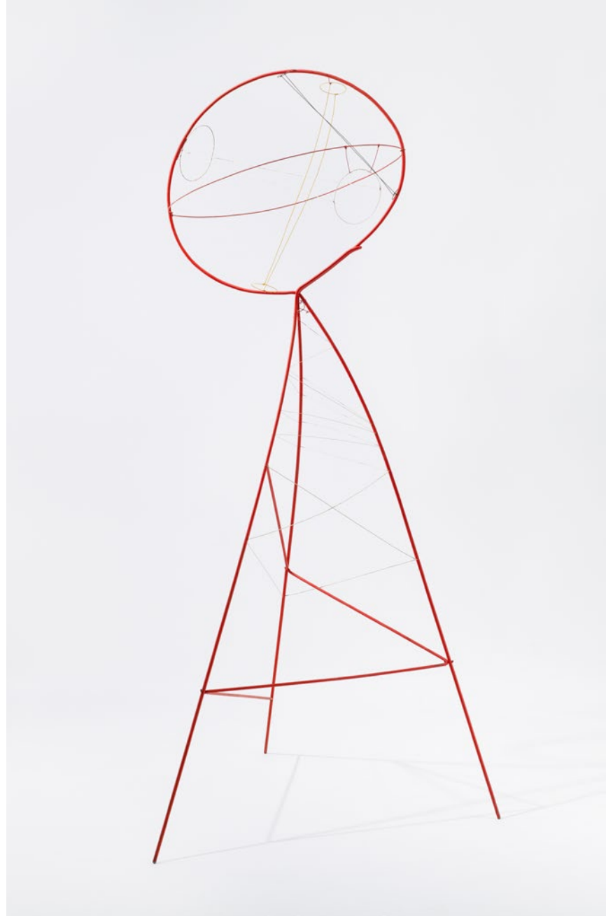
Alexander Calder. Sphere Pierced by Cylinders , 1939. Alambre y pintura. 210,82 x 86,36 x 109,22 cm. Calder Foundation, New York. © 2019 Calder Foundation, New York / VEGAP, Santander.