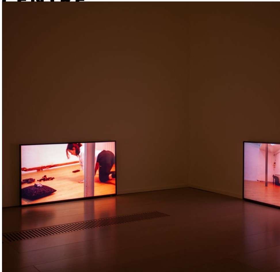
BLANCA ULLOA | Y de pronto estoy muy cansada