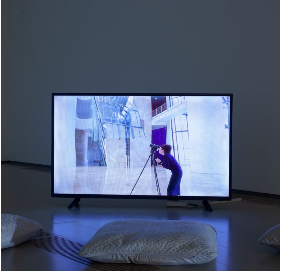
CRISTINA GARRIDO | The (invisible) Art of Documenting Art