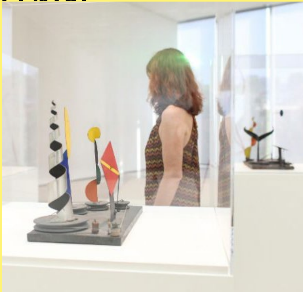
Maquetas para Percival Goodman y la Feria Mundial de Nueva York