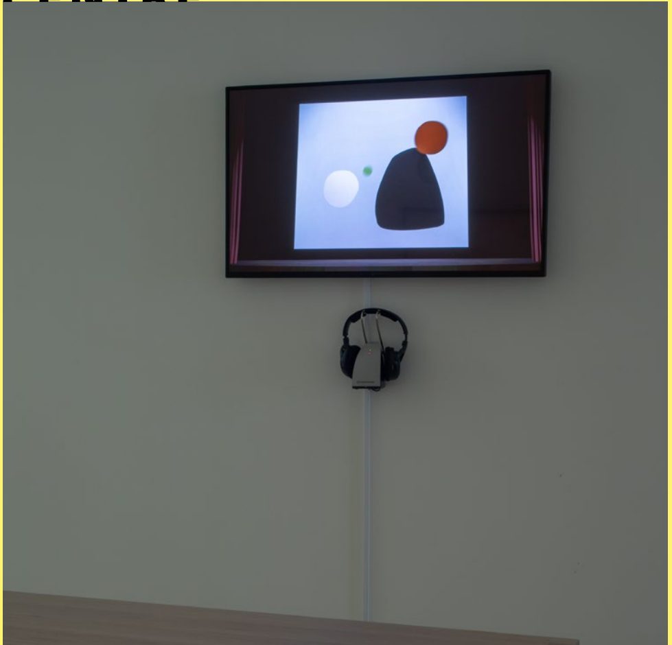
Dentro de la cabeza de Calder