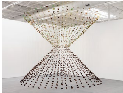
Damián Ortega, Volcán , 2013

Viaje al centro de la Tierra: penetrable (2014) disecciona la imagen del globo